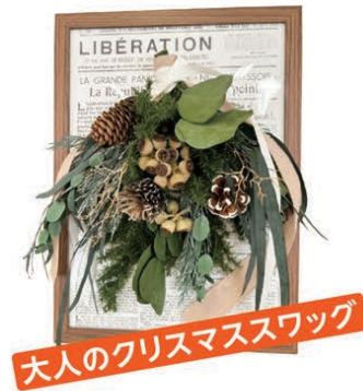
大人のクリスマスワック