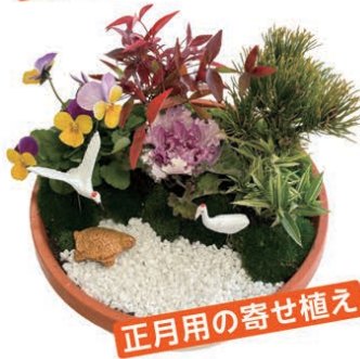
正月用の寄せ植え