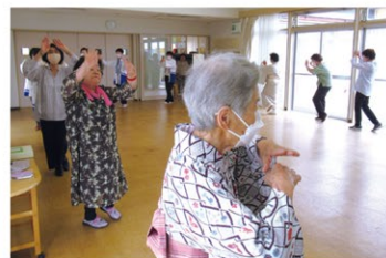
リズムカルにダンスヒーロー