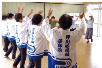
伊川谷音頭を踊る

今年も4回の講習会を実施しました。西婦人会の福元先生、伊川谷音頭保存会の皆さんの指導で、からだも頭も大いに楽しみました。日頃のストレスも吹き飛びます。今年は各地で盆踊りが再開されるようですので、出かけて行って講習の成果を発揮してもらいたいものです。