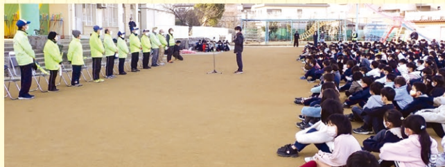
▲ 長坂小学校での感謝集会

これらを励みとして今後も学校・地域の皆様のご協力を頂きながら子どもたちのために活動してまいります。