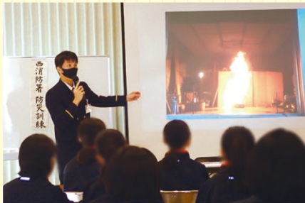
▲ 西消防署による講義と防災訓練