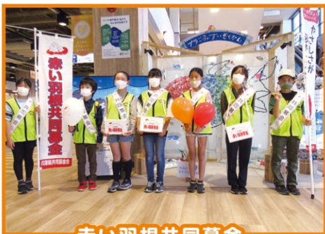
赤い羽根共同募金

活動は年に10回程度で、費用はいりません。新年度の隊員を募集しています。興味のある人はぜひ担任の先生に申し出て下さい。一緒に楽しく活動しましょう。