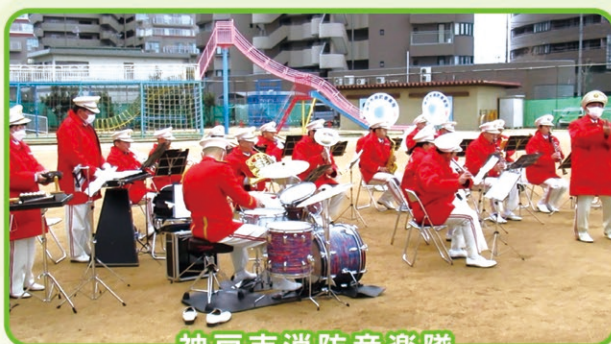
神戸市消防音楽隊