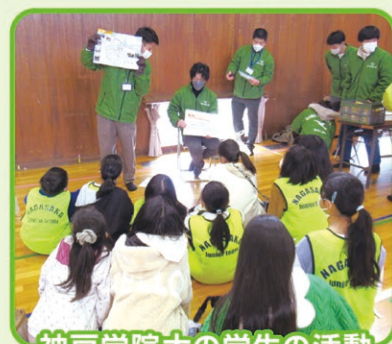
神戸学院大学の学生の活動