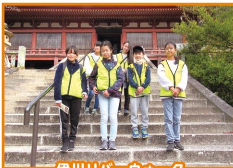
伊川リバーウォーク