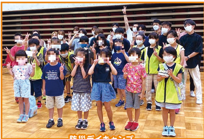
防災デイキャンプ

皆さん、長坂ジュニアチームをご存じですか？長坂小学校の4年生～6年生の人ならどなたでも参加できます。隊員は防災訓練に参加したり、防災について学んだりします。また、地域の人達と一緒にボランティア活動に参加します。長坂ふれあいのまちづくり協議会のメンバーが中心になってこれらの活動を行っています。もう10年以上続いています。下半期の活動は右記の通りです。