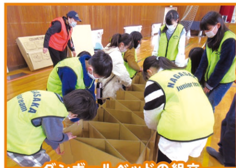
ダンボールベッドの組立