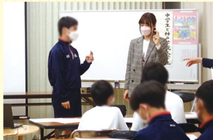
▲ 神戸学院大生との交流会・手話