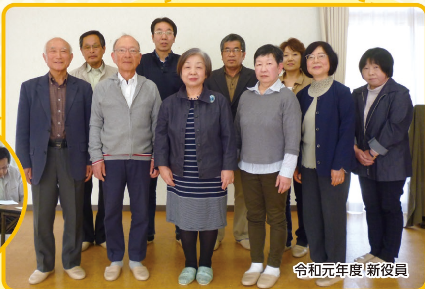
令和元年度 新役員