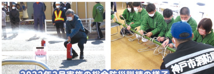
2022年2月実施の総合防災訓練の様子