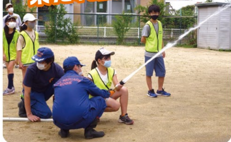
▲ブロック防災訓練：放水出来ました