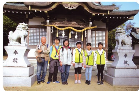
▲伊川流域ウォーキング：前開八幡神社にて