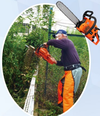
▲チェーンソーを使っている様子

地域福祉センターにおいて、ジュニアチームの6名を含め27名が参加しました。暑い中、消防団の皆さんの指導で全員消火・放水訓練を行いました。今年は防災資機材の展示、実演をし、その中でもチェーンソーを使って大きな丸太を一瞬で切断した際には大きな歓声がおきました。