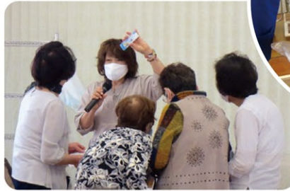
▲説明する久保先生