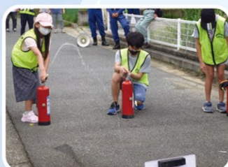
▲ジュニアチームの消火作業