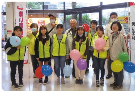
▲赤い羽根共同募金活動