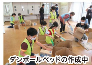
ダンボールベッドの作成中