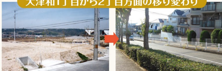
1986年頃 大津和地区開発時